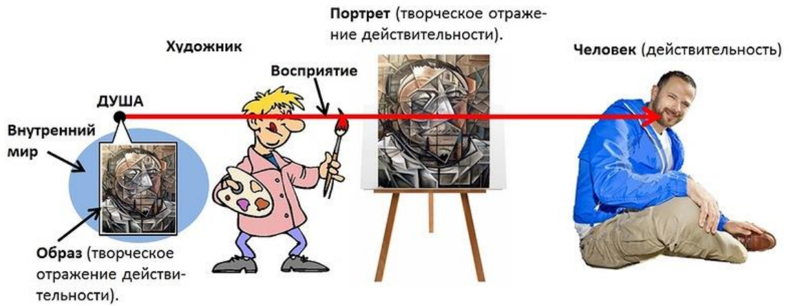
Рис.2 Душа, наблюдая действительность в виде человека через глаза тела, отобразила его в своем внутреннем мире в виде образа, и этот образ – и есть искусство.

Если мы будем рассматривать человека не только как тело, но и как духовное существо (душу), тогда созданные им в своем внутреннем мире образы – есть искусство. Значит каждый из людей, воображающих (мечтающих) о чем-либо – занимается искусством, а когда он рассматривает свои воображаемые образы – он созерцает свое искусство.