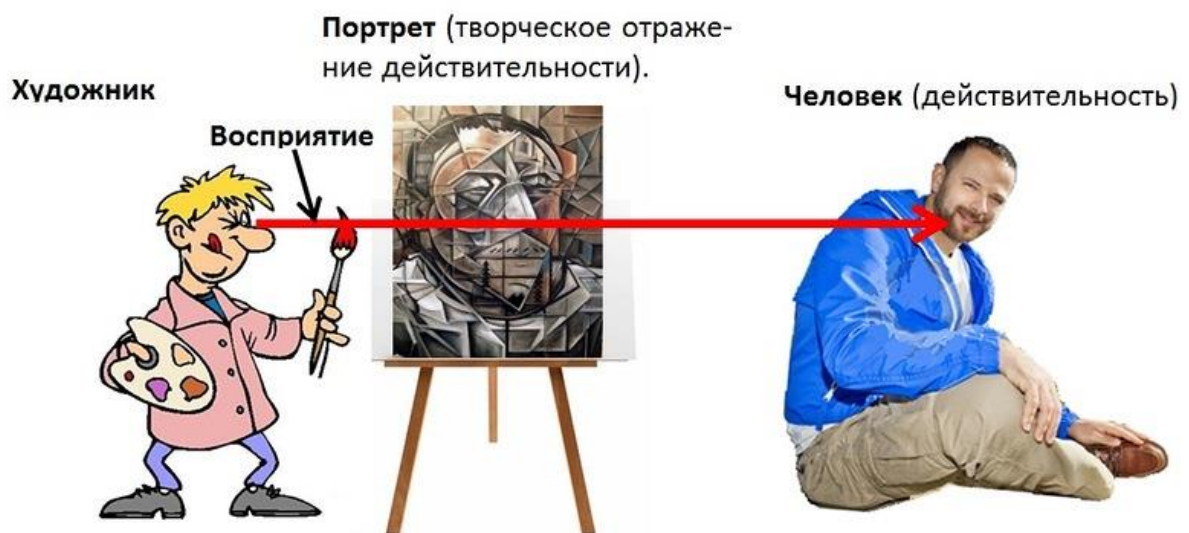
Рис.1 Художник, наблюдая действительность в виде человека, отобразил его портрет особым художественным образом, и этот портрет – есть искусство.

Если нарисовать словарное определение слова «искусство», то получится следующий рисунок: